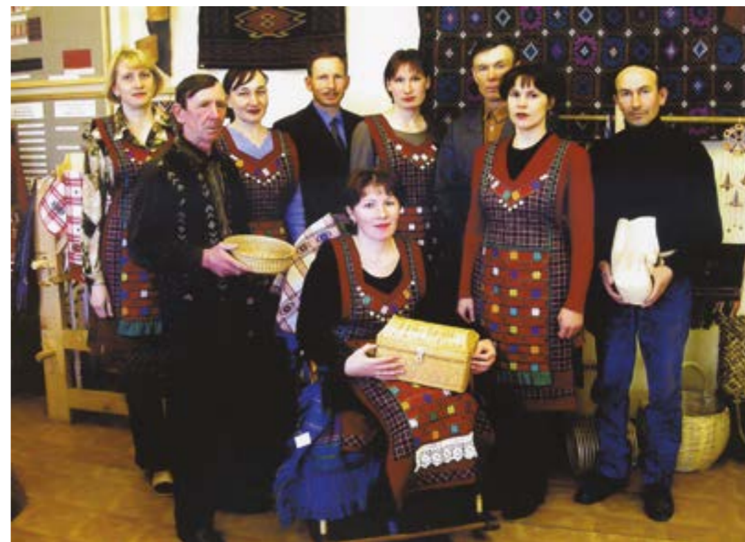
Коллектив Алнашского Центра декоративно-прикладного искусства и ремёсел. 2002 г.

лись новые направления: нар. игрушка, худ. керамика, столярно-токарное ремесло, лоскутное шитьё. Возрождён местный удм. костюм. Методисты ведут работу по восстановлению утрачен. технологий ремёсел, изучают ту этногр. среду, в к-рой эти изделия создавались и использовались. Работы методистов экспонируются на респ. темат. выст. (г. Ижевск), где проводится системат. науч. анализ их идейно-эстет. и технол. уровня. Лучшим высокохуд. работам мастеров присваиваются кат.: «Особо ценное», «Для популяризации ДПИ» либо «Экспериментальное». За этот период сложился узнаваемый алнашский стиль произведений мастеров. Экспозиции