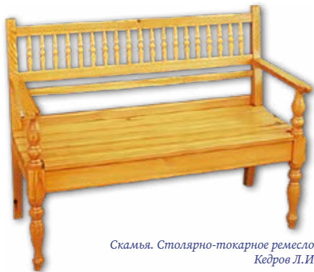
Скамья. Столярно-токарное ремесло. Кедров Л.И.

проведение мастер-кл. «Зорай» Всерос. слёта учен. производств. бригад (2008).