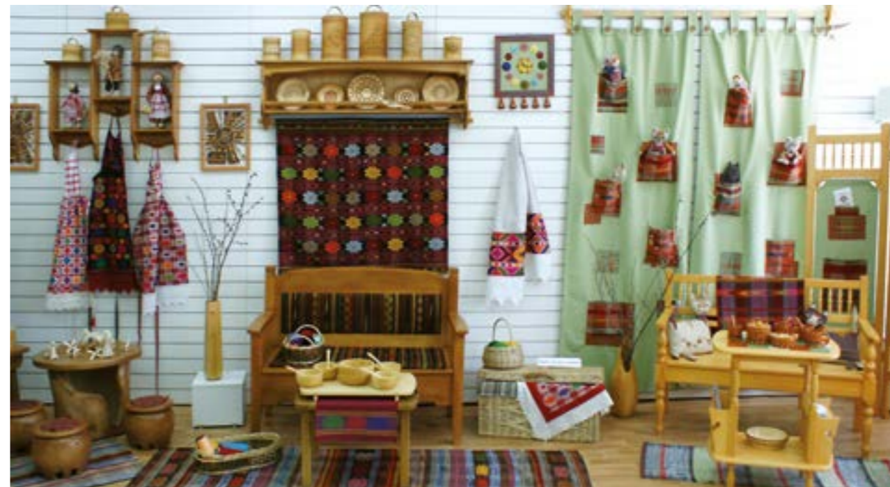
Отчётная выставка Алнашского Центра ДПИиР «Коркаямь шунды пиштэ!» («Солнце в доме!»). НЦДПИиР. 2017 г.

как в мастерских, так и за пределами Центра: в шк., твор. об-ниях, дет. садах р-на. Проводятся темат. экскурсии. Методистами разработаны спец. программы для обучения детей разл. видам ремёсел. Мн. воспитанники являлись лауреатами респ. и всерос. выст. Одна из подмастерьев – участница общерос. Кремлёвской ёлки в Москве. По итогам работы коллектив неоднократно отмечался дипломами, как «Лучший Дом ремёсел Удмуртской Республики» (2004, 2011–13, 2015). За годы работы сплотился коллектив единомышленников, мастеров своего дела. Изделия мастеров востребованы, как в р-не, так и за его пределами. Разл. виды изделий, выполненные на высоком худ. технол. уровне, отражающие потребности быта и эстет. запросы об-ва, этн. узнаваемы и оригинальны в исполнении. Центр являлся сосредоточением нар. культуры, своего рода визитной карточкой Алнашского р-на. За значит. вклад в соц.-экон. развитие Ал-