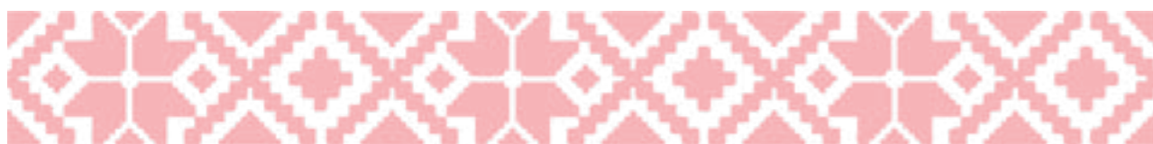
Ковёр. Традиционное ткачество. Измайлова Н.В.