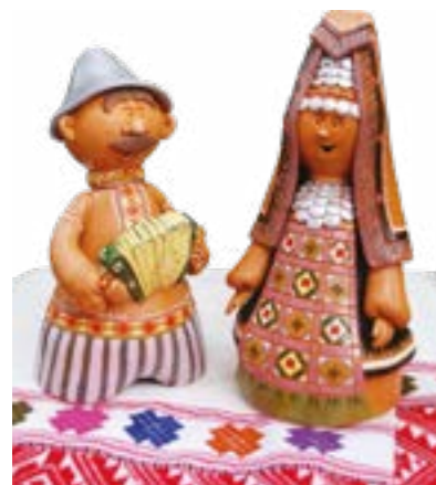
Куклы «Парочка». Художественная керамика. Рысьева Н.А.