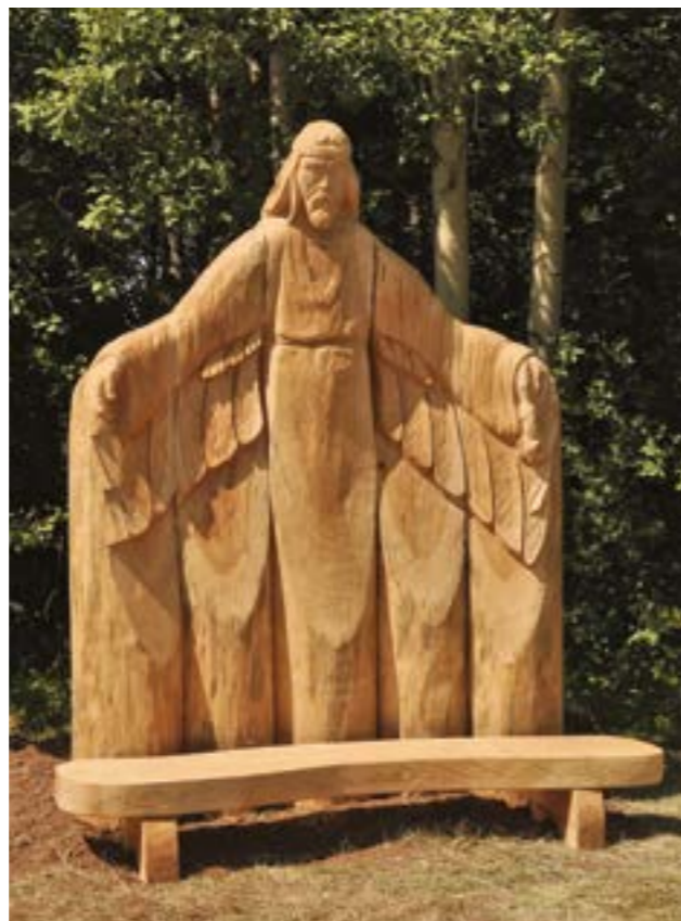
Скульптурная композиция «Нюлэс кузё» («Хозяин леса»). Лермонтов В.А., Печников И.А., Кедров Л.И., Орехов А.В. Главный приз учредителя XII Республиканского и V Межрегионального фестиваля парковой скульптуры. Установлена в АЭМЗ «Лудорвай». 2013 г.

как в мастерских, так и за пределами Центра: в шк., твор. об-ниях, дет. садах р-на. Проводятся темат. экскурсии. Методистами разработаны спец. программы для обучения детей разл. видам ремёсел. Мн. воспитанники являлись лауреатами респ. и всерос. выст. Одна из подмастерьев – участница общерос. Кремлёвской ёлки в Москве. По итогам работы коллектив неоднократно отмечался дипломами, как «Лучший Дом ремёсел Удмуртской Республики» (2004, 2011–13, 2015). За годы работы сплотился коллектив единомышленников, мастеров своего дела. Изделия мастеров востребованы, как в р-не, так и за его пределами. Разл. виды изделий, выполненные на высоком худ. технол. уровне, отражающие потребности быта и эстет. запросы об-ва, этн. узнаваемы и оригинальны в исполнении. Центр являлся сосредоточением нар. культуры, своего рода визитной карточкой Алнашского р-на. За значит. вклад в соц.-экон. развитие Ал-